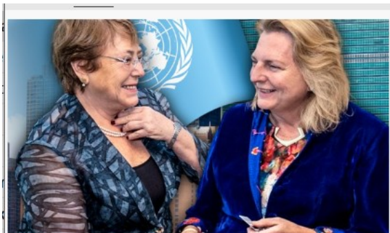
Außenministerin Kneissl (re.) mit UNO-Menschenrechtskommissarin Bachelet