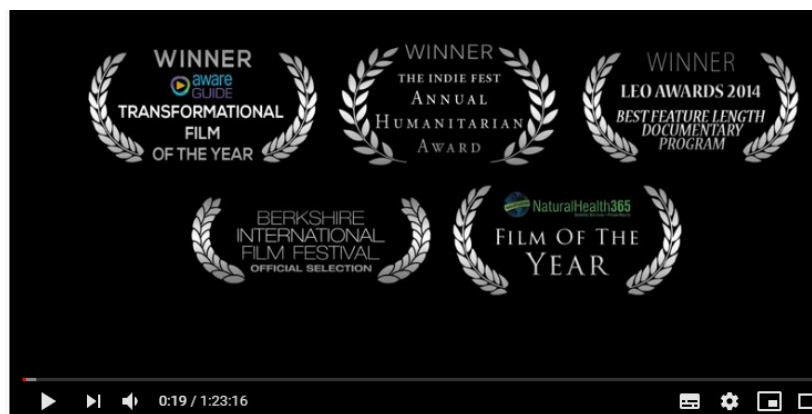
Hol Dir Deine Macht zurück 2017 - offizieller Film