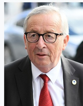
Juncker in October 2019